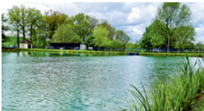
Naturbad Kaimberg

Eintritt: 3,50 €, ermäßigt 2,00 € Familienkarte (2 Erw., 2 Kinder) 8,00 € 10er-Karte 31,50 € www.naturbad-kaimberg.de