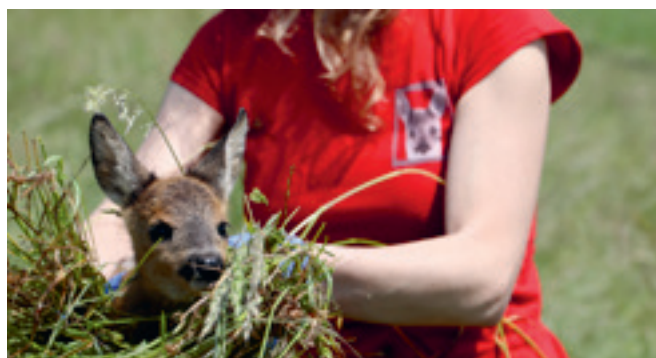
Ein Mitglied des Vereins bei der Rettung eines Kitzes.