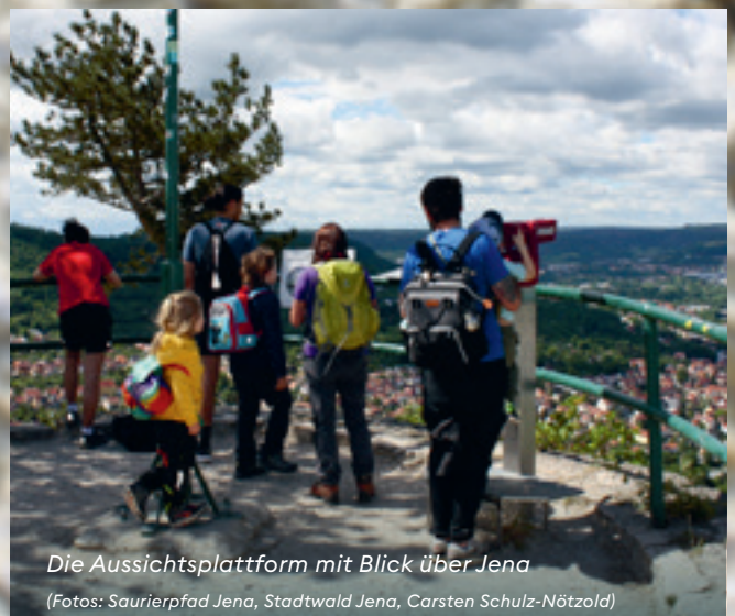
Die Aussichtsplattform mit Blick über Jena

Eine technische Raffinesse sind die virtuellen 3D-Ansichten der Saurier (Hinweistafeln beachten). Mit Augmented Reality lassen sich per Smartphone animierte Saurier in die reale Umgebung projizieren. 360°-Panoramen ermöglichen zusätzlich den Blick auf Jena während der Trias bzw. während der Eiszeit.