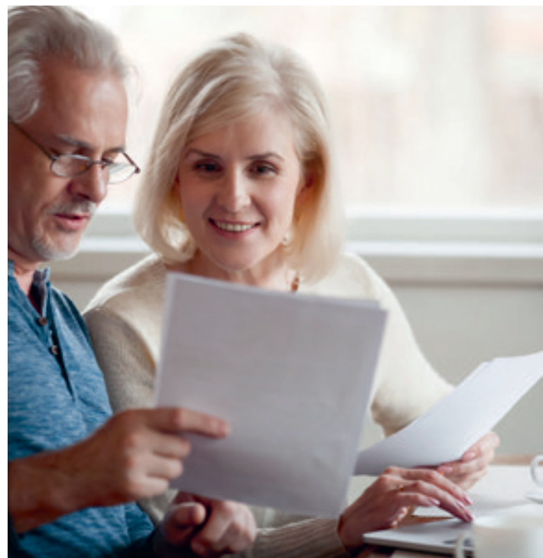
EGG-Kunden profitieren automatisch vom Entfall der EEG-Umlage.

die über den Strompreis gezahlt werden müssen. Bereits seit Monaten ist der Druck auf die Energiepreise enorm. Seit dem Beginn des Ukraine-Kriegs sind die Strom- und Gaspreise an den Börsen noch einmal extrem gestiegen. Auch wenn wir alles daran setzen, die Auswirkungen dieser Entwicklung auf unsere Strompreise zu begrenzen, wird der Wegfall der EEG-Umlage den Anstieg der Strompreise mittelfristig gesehen nicht kompensieren können. Verbraucherinnen und Verbraucher müssen sich leider auf weiter steigende Energiepreise einstellen.“