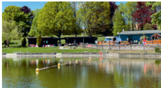
Naturbad Münchenbernsdorf

Eintritt: 3,50 €, ermäßigt 2,00 € Familienkarte (2 Erw., 3 Kinder) 8,00 € 10er-Karte: 28,00 € / Jahreskarte: 50,00 € https://muenchenbernsdorf.de