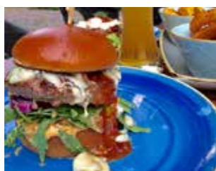
LECKERE BURGER UND KÜHLE GETRÄNKE IM BIERGARTEN

Schließlich schwebte den beiden Inhabern, die bereits seit 2006 gemeinsam das Lummersche Backhaus mit Brückencafé in