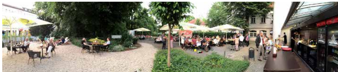
IDYLLE PUR IM COMMA-BIERGARTEN

Das Restaurant im comma bietet internationale Köstlichkeiten und einen gemütlichen Biergarten zur Sommerzeit. Regelmäßig gibt es zur Kulinarik auch Kulturprogramm.