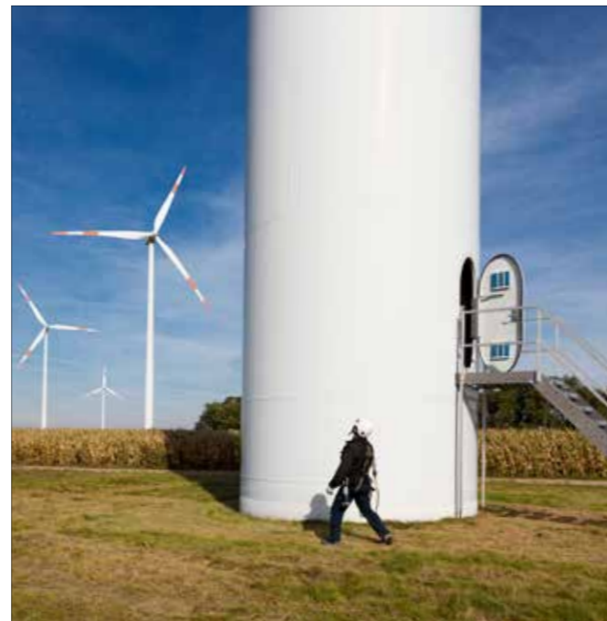
WINDKRAFTANLAGEN IMMER LEISTUNGSSTÄRKER

Land gebaut werden (Onshore-Windparks). Den Windkraftanlagen an Land kommt eine besonders wichtige Rolle zu. Sie sind die treibende Kraft der Energiewende und haben sich in den letzten zwei Jahrzehnten aus einer Nische heraus zur heute führenden erneuerbaren Energie entwickelt. Im vergangenen Jahr erzeugten Onshore-Windparks laut Fraunhofer ISE 66 TWh Strom. Offshore Wind konnte die Produktion von 8 TWh in 2015 auf ca. 12 TWh in 2016 steigern. Dabei konzentriert sich die Windkraft besonders in der Nordsee (ca. 10,7 TWh), die Ostsee nimmt nur eine kleinere Rolle ein (1,3 TWh). Neben der Menge des erzeugten Stroms ist die Onshore-Windenergie auch im Hinblick auf die Kosten sehr leistungsfähig: Sie ist unter den erneuerbaren Energien die kostengünstigste.