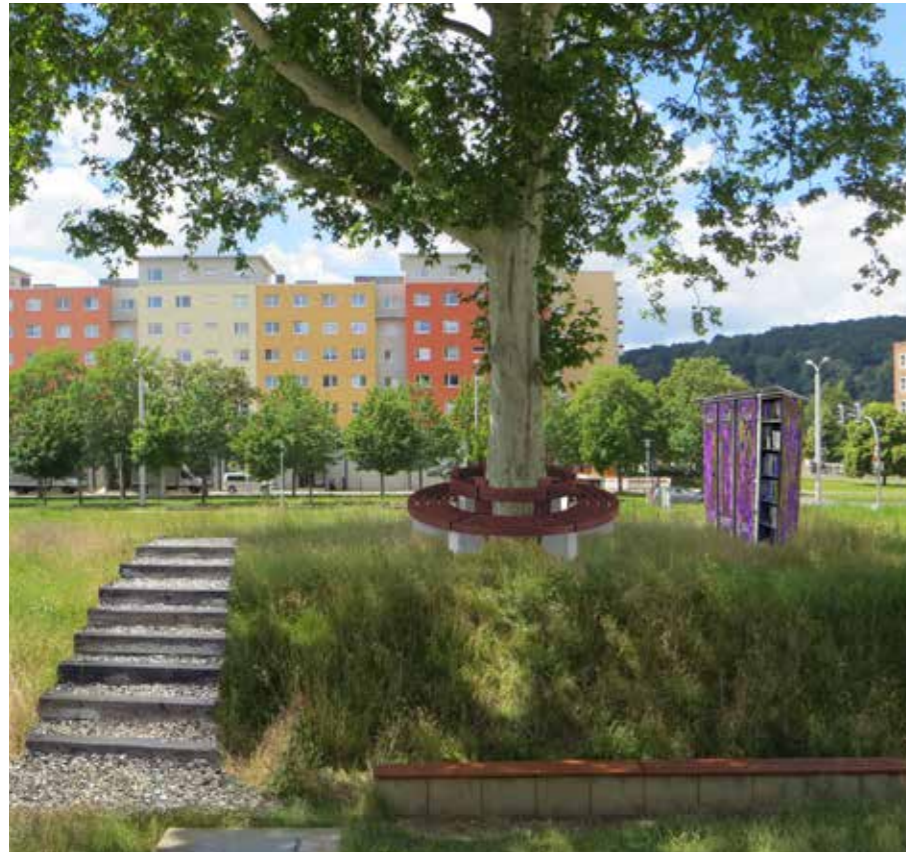
SO SOLL ES EINMAL AUSSEHEN – EIN GEMÜTLICHES FLECKCHEN UNTER DER PRÄCHTIGEN PLATANE

Ein prächtiger Baum auf einer kleinen, grün bewachsenen Anhöhe direkt vor der Stadt- und Regionalbibliothek Gera – ein Ort, der bestens geeignet ist, um kurz innezuhalten und dabei ein Buch unter freiem Himmel zu lesen.