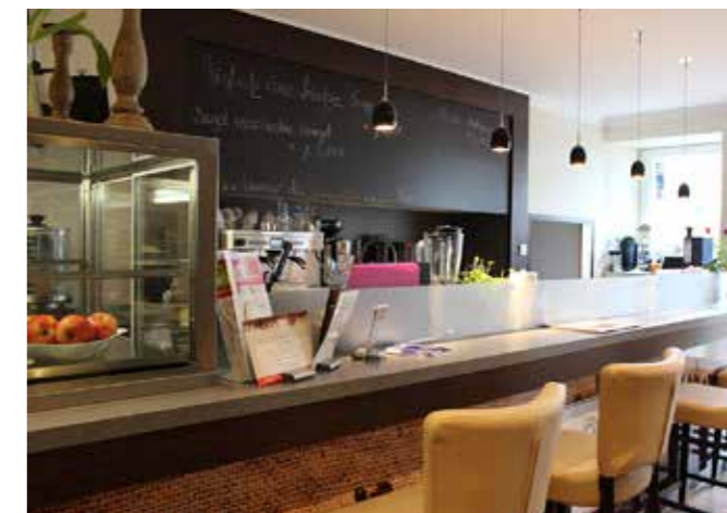
DAS CAFÉ MEDICUM BIETET SEINEN GÄSTEN DUFTENDEN KAFFEE, KUCHEN UND SNACKS IN GEMÜTLICHEM AMBIENTE

Nach aufwendigen Sanierungsarbeiten ist es seit 2015 als Medicum Gera neue Wirkungsstätte einer Praxis für HNO und Sportmedizin, einer Gemeinschaftspraxis für Allgemeine und Innere Medizin sowie Diabetologie und einer Augenärztin. Ebenso zu finden sind im Medicum ein Hörakustiker, ein Ergotherapeut und eine Apotheke. Noch in diesem Jahr eröffnet zudem eine Zahnarztpraxis. Das Operations Centrum, wo aufwendigere Operationen vor Ort durchgeführt werden können, wird von verschiedenen Ärzten des Hauses genutzt. Im hinteren Bereich des Gesundheitszentrums erstreckt sich ein gemütlicher Freisitz des Café Medicum.