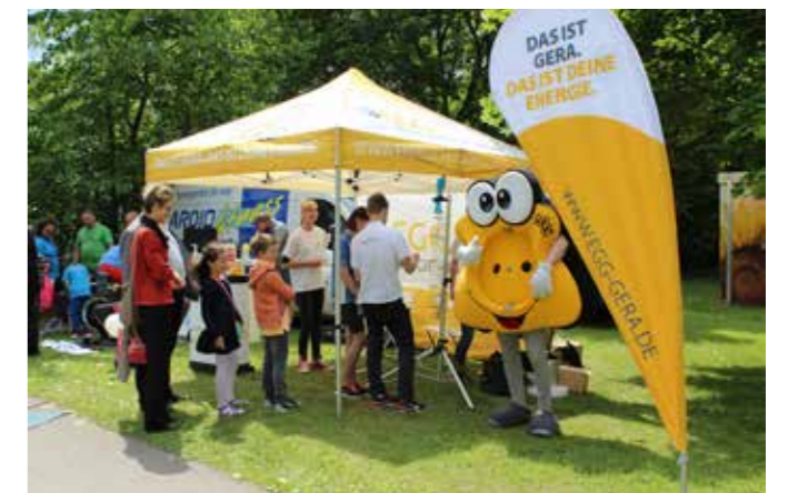
BESTE STIMMUNG AM STAND DER EGG