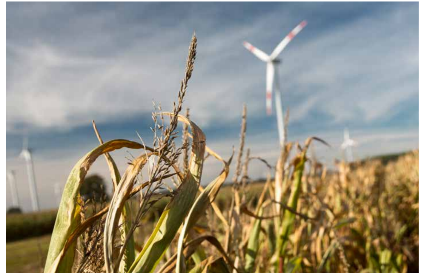
AUSBAU DER WINDKRAFTANLAGEN FÜR ERREICHUNG DER KLIMASCHUTZZIELE UNVERZICHTBAR

Parallel zu Neuinstallationen macht das sog. Repowering auf Grund des enormen Leistungsunterschiedes zwischen älteren und Windkraftanlagen der neuesten Generation nachvollziehbar Sinn. Dabei werden alte Windkraftanlagen der ersten Generation durch leistungsfähigere Anlagen