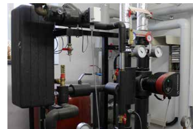
MODERNE HEIZANLAGE MACHT ALTE BOILER ÜBERFLÜSSIG

Wo sich früher der Kohlebunker befand, können heute Kaffee getrunken und diverse Speisen genossen werden. Nichts erinnert mehr an die Kohleöfen, die sich hinter dem Tresen befanden, auf dem heute eine Siebträgerkaffeemaschine leckeren, dampfenden Kaffee produziert. Kohlebunker und -öfen braucht es schon lang nicht mehr.