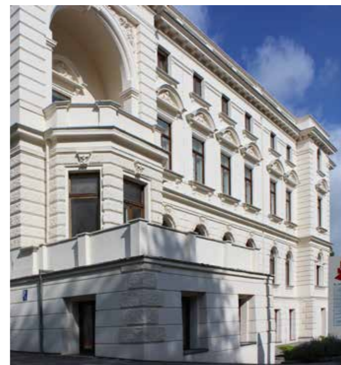
DAS GESUNDHEITZENTRUM MEDICUM IN DER ZABELSTRASSE 3

Gera hat einiges an imposanter, historischer Bausubstanz zu bieten. Zeugnisse einer industriell erfolgreichen und wohlhabenden Zeit um die Jahrhundertwende des 19. und 20. Jahrhunderts.