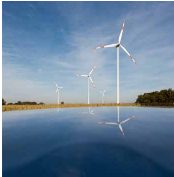
OFFSHORE-WINDANLAGEN LIEFERTEN 2016 12 TWH STROM

Bis Ende des Jahres 2016 lieferten hierzulande 28.217 Windkraftanlagen etwa 12,3 % des in Deutschland erzeugten Stroms. Der Wind leistete mit fast 80 Terrawattstunden (TWh) insgesamt den größten Beitrag zur Stromerzeugung aus erneuerbaren Energien.