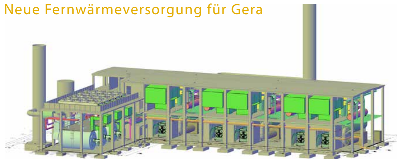
3D-ENTWURF NEUBAU KWK-ANLAGE HKW-TINZ (GERA-NORD)

Die Energieversorgung Gera (EGG) und ENGIE Deutschland, seit November 2016 zu 100 % Anteilseigner der EGG, werden die Fernwärmeversorgung in Gera optimieren. Gemeinsam haben beide Unternehmen eine Lösung erarbeitet, mit der sowohl die Erzeugungsanlagen für Strom und Wärme als auch das Fernwärmenetz auf die veränderten lokalen Anforderungen angepasst werden. ENGIE plant die Errichtung von neun gasbetriebenen Blockheizkraftwerken (BHKW) sowie Gaskesselanlagen mit einer Leistung von insgesamt 145 MW thermisch und 40,5 MW elektrisch, die Strom und Wärme erzeugen. Sie werden an zwei Standorten in Lusan (Gera-Süd) und Tinz (Gera-Nord) aufgestellt. Die EGG wird die erzeugte Wärme auf Basis eines Wärmelieferungsvertrages zur Versorgung der Kunden in Gera abnehmen. Die erheblichen Finanzierungsaufwendungen, einen mittleren zweistelligen Millionen-Betrag, zur Errichtung der Anlagen trägt ENGIE.