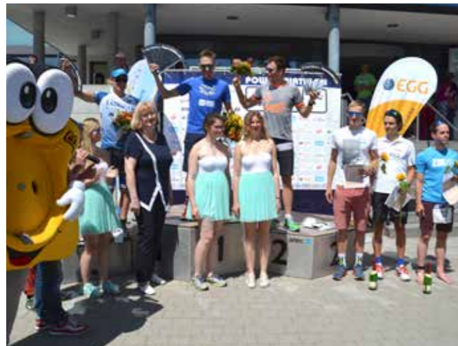
DIE BESTEN 6 DES EGG-POWERTRIATHLONS

Dabei ist die EGG Namensgeber des anspruchsvollsten Wettkampfes des Tages – dem EGG Powertriathlon über die olympische Disziplin. Das Starterfeld ist ein hochkarätiger Mix aus Profis und Semiprofis, bei denen auch die Gerschen Triathleten des TSV 1880 Gera-Zwötzen einen starken Eindruck hinterließen.