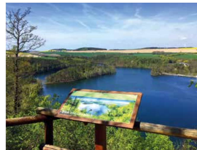
AUSSICHTSPUNKT GROBISCH MIT BLICK ÜBER DAS „ZEULENRODAER MEER“

erfreuen sich Naturfreunde an den neuen Wanderhütten mit wunderschönen Schnitzereien aus der Märchen- und Sagenwelt.