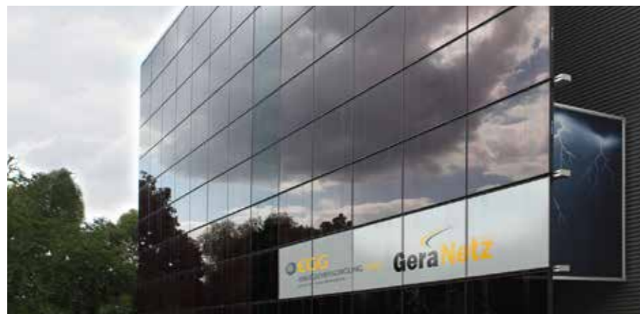
FUNKTIONAL UND SCHÖN ANZUSEHEN – DIE FASSADE DES SCHALTHAUSES GERA SÜD MIT 105 DÜNNSCHICHT-PHOTOVOLTAIKMODULEN

einer Leistung von 17,8 KW installiert. Beim Neubau des Umspannwerkes Gera Süd am Zwötzener Steg im Jahr 2009 wurde die Fassade und die Dachfläche mit einer Photovoltaikanlage mit einer Leistung von 34,4 KW versehen. Für den Neubau des Schalthauses erhielt die EGG 2010 sogar den Deutschen Solarpreis. Gewürdigt wurde die gelungene Verbindung von Funktionalität, umweltfreundlicher Stromerzeugung und modernem Design. Mit diesen Anlagen betrieb die EGG zu diesem Zeitpunkt bereits Photovoltaikanlagen mit einer Gesamtleistung von 63,7 KW.