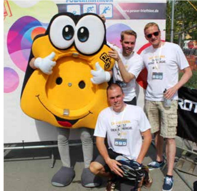
EGG-STAFFELTEAM ZUFRIEDEN MIT LEISTUNG

mit EGGi über Platz 26 von über 40 gestarteten Teams. Unter dem Team-Motto „No Limits just Miles“ ging es daran, dem gemeinsamen sportlichen Ziel ein wenig näher zu kommen. Dieses lautet: „Der Bauch muss weg“.