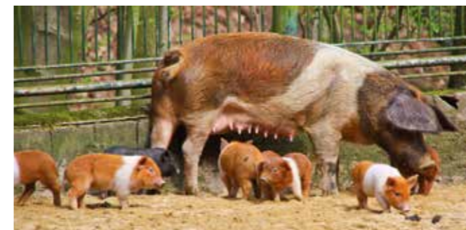
DIE STOLZE SCHWEINEMAMA MIMI UND IHRE FERKEL

Im Dezember 2015 übernahm die EGG die Tierpatenschaft für die Rotbunten Husumer Schweine des Tierparks Gera, im Volksmund auch Protestschweine genannt. Bereits zu diesem Zeitpunkt waren die beiden Schweinedamen trächtig.