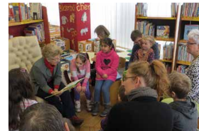
„BÜCHER BEISSEN NICHT“ BUCHPATEN LESEN IN DER BIBLIOTHEK VOR

Der Förderverein Buch & Leser jedenfalls hat nun ein begehrtes Mittel mehr, um Kinder für das Lesen zu begeistern.