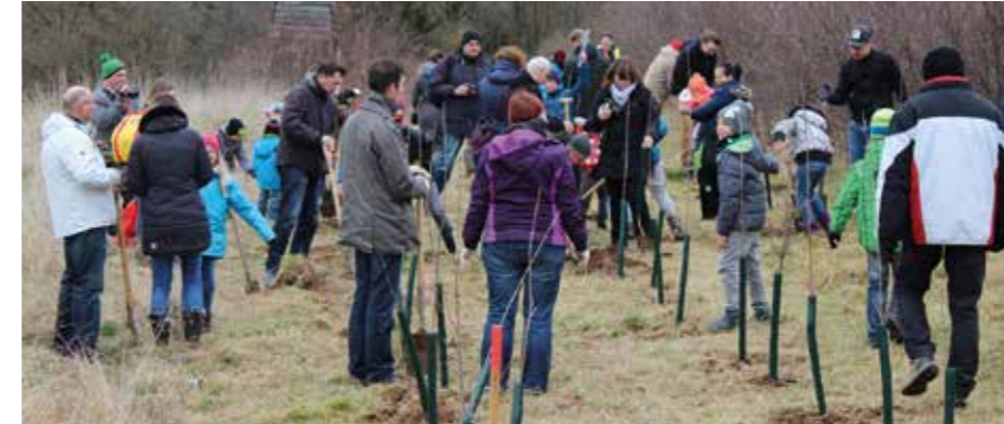
KINDER PFLANZTEN VOGELKIRSCH- UND BERGAHORNBÄUME

Mit Unterstützung der EGG 300 Bäume in Gera gepflanzt