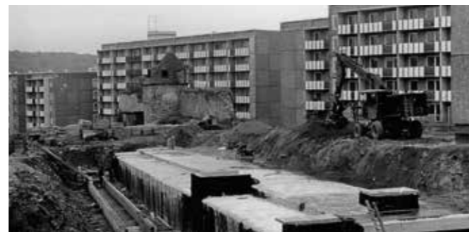
BAU DES HEIZKOLLEKTORS AM STADTGRABEN IM JULI 1980.

Natürlich sollte auch das Stadtzentrum mit Fernwärme versorgt werden. Ein Anschluss der Neubauten und historischen Gebäude im Stadtkern folgte. Um auch die Beheizung und Warmwasserversorgung des Rathauses vom Kohlebetrieb auf Fernwärme umzustellen, erfolgte 1980 der Bau des unterirdischen Heizkollektors am Stadtgraben, über den künftig das Rathaus mit Fernwärme versorgt wurde.