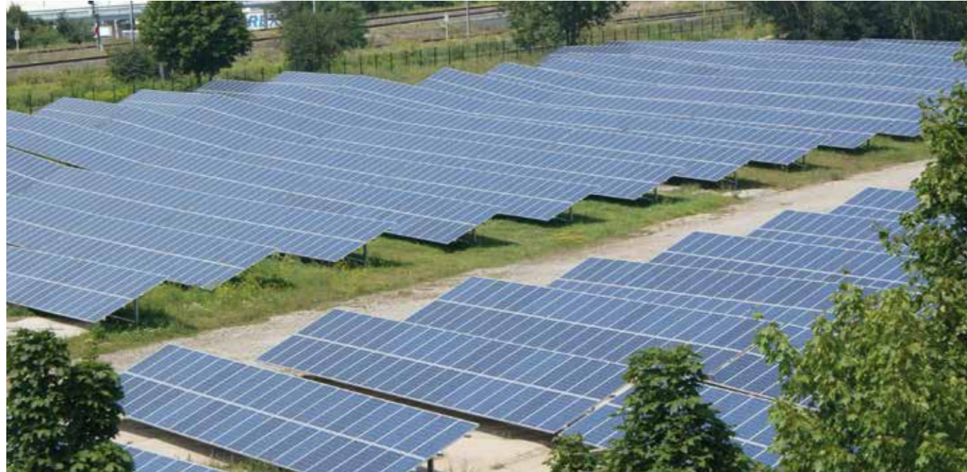
4.900 SOLARMODULE IN DER GASWERKSTRASSE ERZEUGEN ÖKOSTROM

In den kommenden Ausgaben des EGG Magazins werden wir Ihnen in unserer neuen Rubrik „Energie-wende heute und in Zukunft“ Möglichkeiten der nachhaltigen Energieerzeugung vorstellen. Beginnen wollen wir dabei mit der Energieerzeugung über Photovoltaikanlagen.