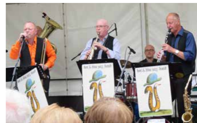
MUSIKER EINER JAZZBAND AUF DER FÊTE DE LA MUSIQUE

In Paris ist es in diesem Jahr die 35. Auflage der Fête de la Musique, in Gera erst die dritte. Doch es ist gelungen, dieses weltweit größte Straßenmusikfest auch in Gera zu einer festen Größe im Kulturleben der Stadt zu machen.