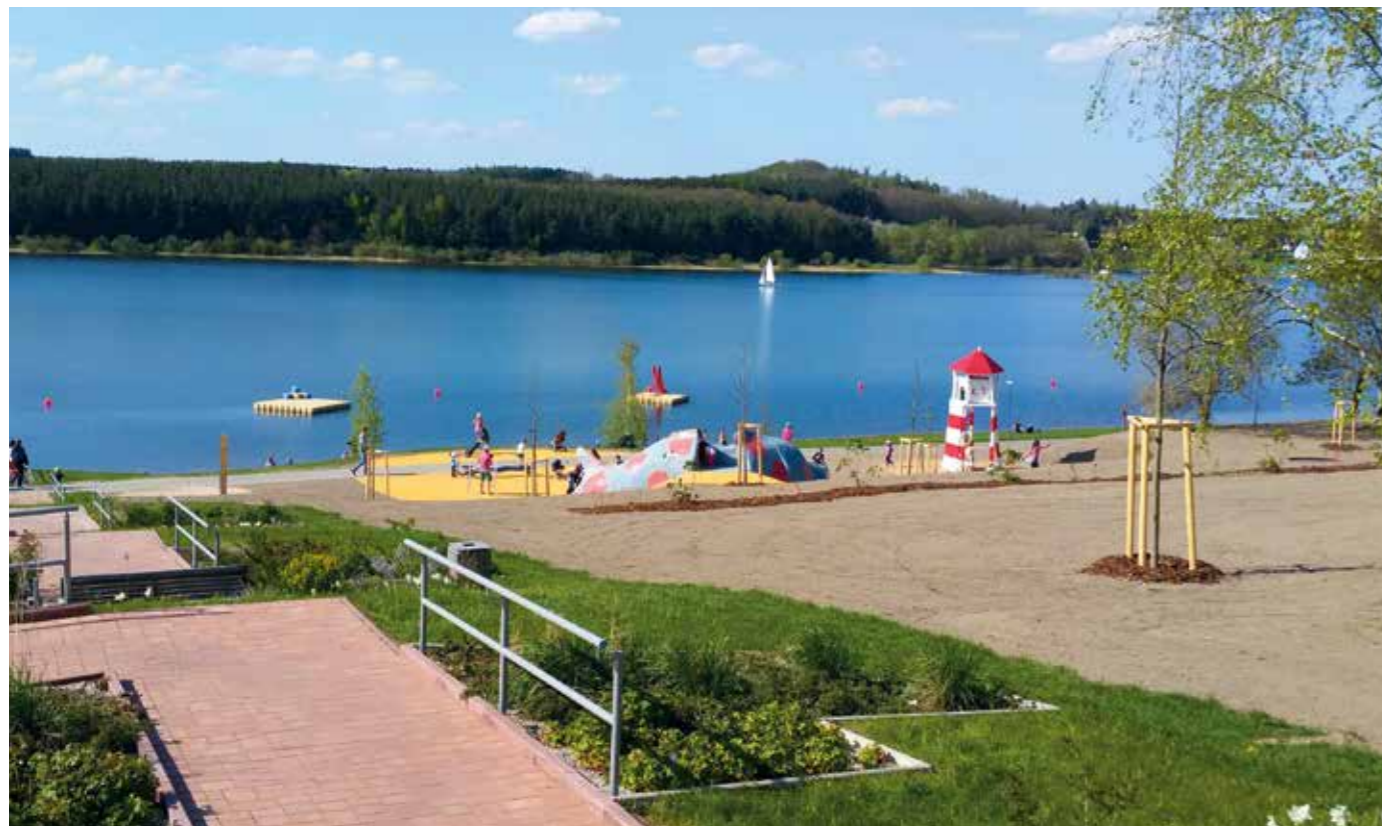
DAS STRANDBAD ZEULENRODA BIETET SPASS UND ENTSPANNUNG

Unser Ausflugstipp: „Das Zeulenrodaer Meer“