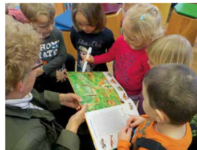
TING HÖRSTIFTE UND BÜCHER BEGEISTERN DIE KINDER