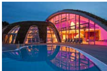
Ein Wellness Wochenende in der Hotel- und Gesundheitsanlage Bad Sulza, der „Toskana des Ostens“

Augen, Gaumen und Gemüt. Sicherlich ein absoluter Höhepunkt – die weltberühmte Loreley-Passage und das UNESCO-Welterbe Mittelrheintal. An und Abreise erfolgt im modernen Reisebus.