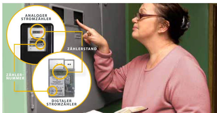
ABBILDUNG DER ZÄHLERMODELLE ÄHNLICH

Ihr Stromzähler versteckt sich unauffällig in Flur oder Keller – trotzdem sollten Sie ihm von Zeit zu Zeit einen Besuch abstatten.