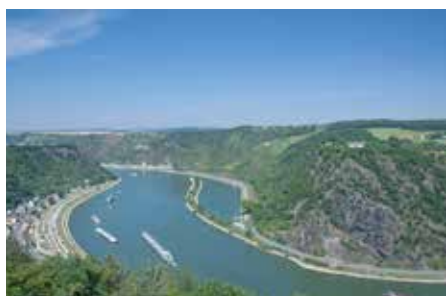
Kreuzfahrt auf dem Rhein (8 Tage inkl. 7x Übernachtung)

Mal so richtig Seeluft schnuppern und den ostdeutschen Ostseeeinseln einen Besuch abstatten, das wäre doch was. Gesagt, getan! Hier ist die Reise für alle Landratten, die scharf aufs Inselleben sind. Denn davon haben Sie hier genug. Besuchen Sie die wohl schönsten Inseln an der deutschen Ostseeküste. Erleben Sie die Kaiserbäder Usedom, die weißen Kreidefelsen Rügens, das malerische Hiddensee und den urwüchsigen Darß. Jeden Tag eine neue Insel, jeden Tag eine neue Entdeckungsreise.