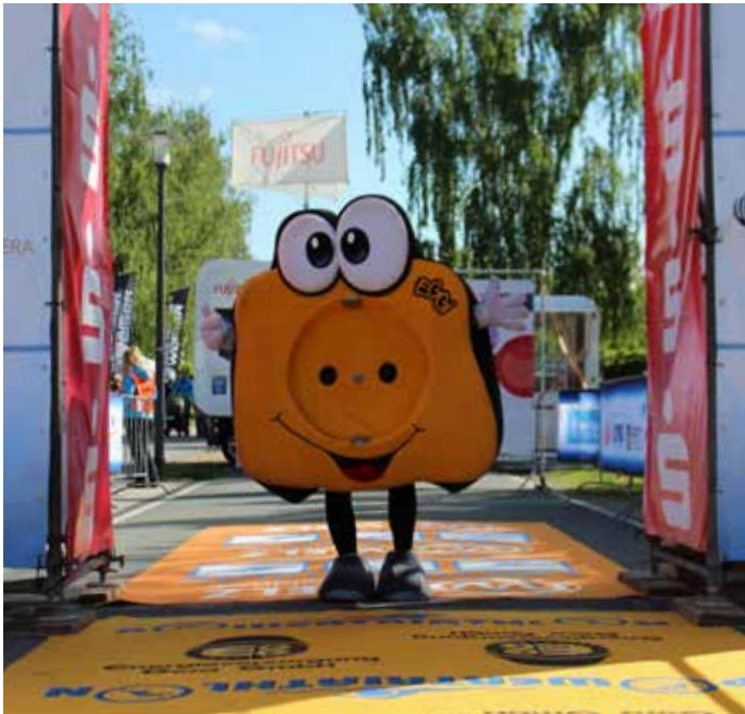
EGGI BEIM ZIELEINLAUF GEFEIERT.