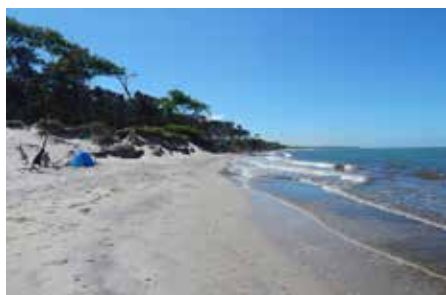
Die Inselkieker-Reise: Rügen – Usedom – Hiddensee – Darß (6 Tage Busreise)

„Warum in die Ferne schweifen? Sieh, das Gute liegt so nah“, stellte Goethe einst fest. Und Recht hat er gehabt. Oft zieht es uns in die weite Ferne und dabei übersehen wir die schönsten Reiseziele direkt vor der eigenen Haustür. Nun steht die Sommerurlaubszeit wieder kurz bevor und immer mehr Menschen jeden Alters entdecken Deutschlands wunderbare Landschaften oder spannende Städte für sich. Genießen Sie die Sonne und das Wasser an der Ostsee, durchwandern Sie das Altmühltal, erleben Sie die Metropole Berlin in Verbindung mit einem Musical-Besuch, lassen Sie sich von der Blütenpracht auf einer Bundes- oder Landesgartenschau verzaubern, erkunden Sie Deutschlands Flüsse oder entspannen Sie bei einem Wellness-Wochenende. In unserer aktuellen Ausgabe haben wir für Sie fünf Reisetipps für einen wunderschönen Sommerurlaub in Deutschland zusammengestellt.