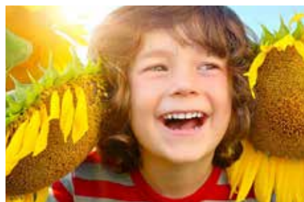
Nicht nur für Gartenfreunde ... Besuchen Sie die Bundes- oder eine Landesgartenschau

Ferien für Leib und Seele. Hier findet jeder das Passende. Besuchen Sie die legendäre Toskana Therme. Lassen Sie sich bei einem Entspannungsbad oder einer Ganzkörpermassage verwöhnen. Neben paradiesischen Wellness- und Spa-Angeboten können Sie sich an liebevoll gepflegten Gartenanlagen erfreuen und den Tag in einem tollen Restaurant mit Vollwertküche ausklingen lassen.