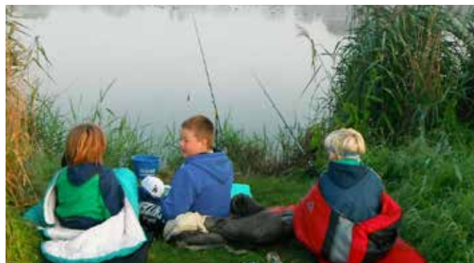
ANGELN MIT FREUNDEN AM MORGEN

An 6 Tagen Reitunterricht in Gruppen für Anfänger und Fortgeschrittene (Reitplatz und Reithalle), Beteiligung an der Pferdepflege, Ausreiten ins Gelände, Begleiten der Pferde zur Koppel, Hunde, Katzen, Ponys und Hängebauchschweine zum Streicheln, Waldbad, Ballspiele, Kreativangebote, Nachtwanderung, Bummel durch die Altstadt.