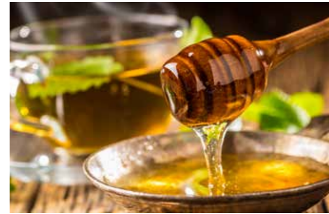
RAPS-, FRÜHLINGS- UND SOMMERHONIG WERDEN DIE BIENEN AUF DEM BETRIEBSGELÄNDE DER EGG ERZEUGEN

Die Biene ist das kleinste Nutztier der Welt. Nach Rind und Schwein ist sie das dritt wichtigste Lebewesen für den