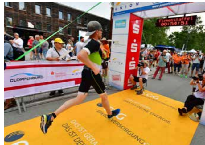
DIE LETZTEN METER INS ZIEL GING ES FÜR ALLE ATHLETEN ÜBER DEN EGG-ZIELTEPPICH

Als einer der Hauptsponsoren zeigte die EGG ordentlich Präsenz: Der im letzten Jahr neu angeschaffte EGG-Zielteppich gab dem Endspurt der Athleten auch in diesem Jahr einen Rahmen.