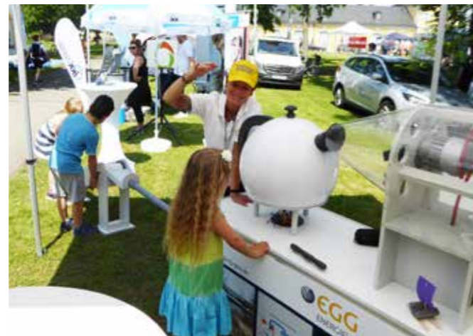
DIE EGG SPIELSTRASSE DEMONSTRIERT DAS ENTSTEHEN VON FERNWÄRME

Am Unternehmensstand warteten Spiel und Spaß sowie tolle Gewinne beim Glücksrad auf die Besucher. Auch die Wissensvermittlung kam nicht zu kurz: Passend zur aktuellen Neuaufstellung der Fernwärmeversorgung brachte die EGG eine Spielstraße zum Thema Fernwärme mit. Auf spielerische Art konnten alle kleinen und großen interessierten Gäste so erleben, wie Fernwärme entsteht und vom Kraftwerk zu den Verbrauchern geleitet wird. Sie konnten über einen Generator selbst Strom erzeugen, den Weg des Wasserdampfes bis zur Erzeugung der Fernwärme verfolgen und so die effektive Wirkungsweise der Kraft-Wärme-Kopplung kennenlernen.