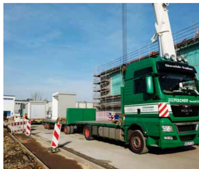
ZWEI SATTELSCHLEPPER BRINGEN DIE GEBÄUDETEILE, IN DENEN DIE GASDRUCKREGELMESSANLAGE (GDRM) INSTALLIERT WIRD

Ende April brachten zwei Schwertransporter die fertig montierten Gebäudeteile für die Gasdruckregelmessanlage zum Kraftwerk Tinz. Die Gebäudehülle wiegt stolze 40 Tonnen. Deshalb musste die technische Anlage separat geliefert und eingebaut werden. Künftig wird diese Gasdruckregelmessanlage das aus dem Stadthochdrucknetz ankommende Gas von 7 auf 2,5 bar herunterregeln und anschließend den BHKWs zuführen. Gleichzeitig überträgt die Gasdruckregelanlage wichtige Informationen an die EGG-Leitstelle und ermöglicht so eine Fernsteuerung und -überwachung rund um die Uhr.