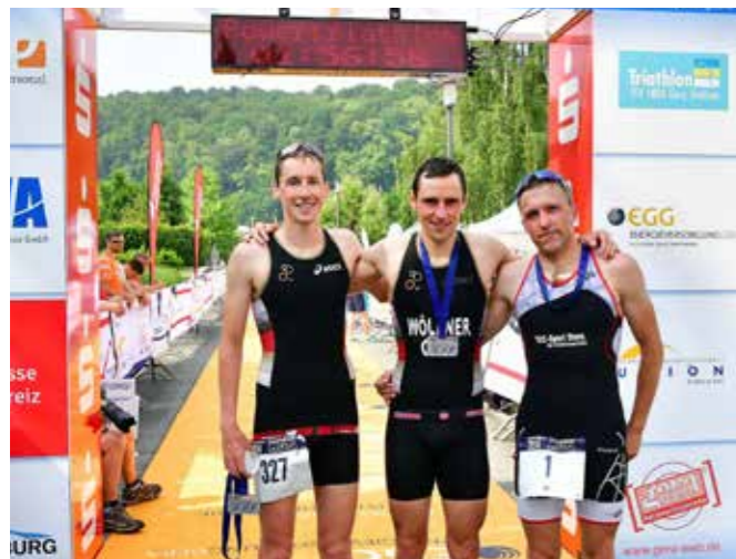
DIE DREI ERSTPLATZIERTEN ÜBER DIE OLYMPISCHE DISTANZ

Wegen der stetig zunehmenden Teilnehmerzahlen fanden die Schüler- und Jugendwettkämpfe bereits am Samstag statt. Mit größtem Energieeinsatz machten die Jüngsten den sportlichen Auftakt. Um 14.30 Uhr starteten im Wettkampf Schüler D die Jahrgänge 2012/2011, gefolgt von den Schülern C 2010/2009 und den Schülern B der Jahrgänge 2008/2007. Die 6- bis 11-Jährigen genossen die ungeteilte Aufmerksamkeit – auch von EGGi, dem sympathischen Maskottchen der Energieversorgung Gera.