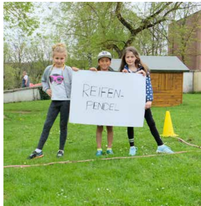
AUF DIESER WIESE WIRD BALD MIT UNTERSTÜTZUNG DER EGG EIN KLETTERGARTEN FÜR DIE KINDER ERRICHTET

EGG finanziert Klettergarten an der Grundschule Saarbachtal