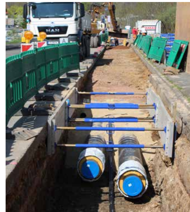
VON DER INDUSTRIESTRASSE BIS ZUR BEETHOVENSTRASSE ENTSTEHT EINE NEUE HAUPTTRASSE HEISSWASSER

Fernwärme-Anschluss HKW Tinz und HKW Lusan