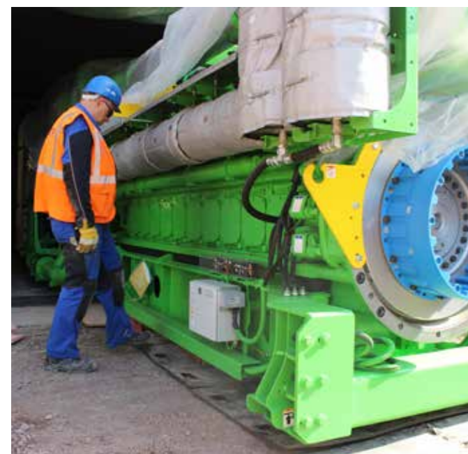
MASSARBEIT – MOTOREN WERDEN AUF PANZERROLLEN ABGESTELLT UND IN DIE HALLE GEZOGEN

Verläuft alles weiter so reibungslos wie bisher, können alle neun Blockheizkraftwerke nach einer Testphase Ende 2018 ihren Betrieb aufnehmen und damit das Kraftwerk Gera-Nord sowie das Heizwerk Gera-Süd nach über 20 Jahren Dienstzeit ablösen.