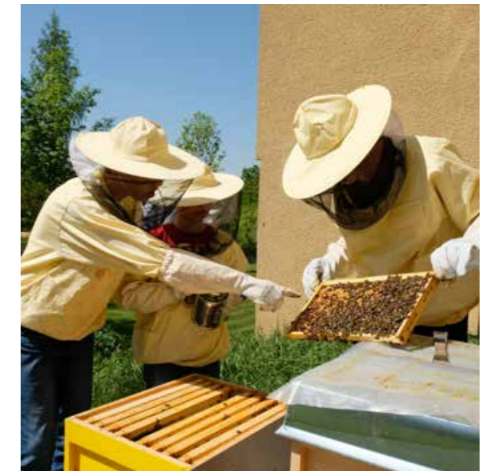
HALTEN DAS IMKERHANDWERK AM LEBEN – SCHÜLER DER AG „JUNGE IMKER“