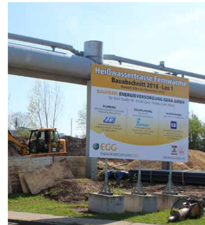
DER BAU DER HEISSWASSERTRASSE IST IN VOLLEM GANGE

Im Zusammenhang mit dem Neubau des Heizkraftwerkes Tinz erfolgt durch die EGG die Errichtung einer neuen Haupttrasse Heißwasser von der Industriestraße bis zur Beethovenstraße. Der Neubau löst die bestehende Hochdruckdampftrasse ab. Die Bauarbeiten, die im März begannen, werden voraussichtlich bis Mitte 2019 andauern.