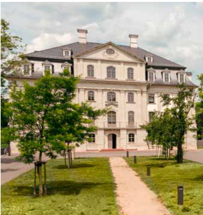
Campus Duale Hochschule Gera-Eisenach