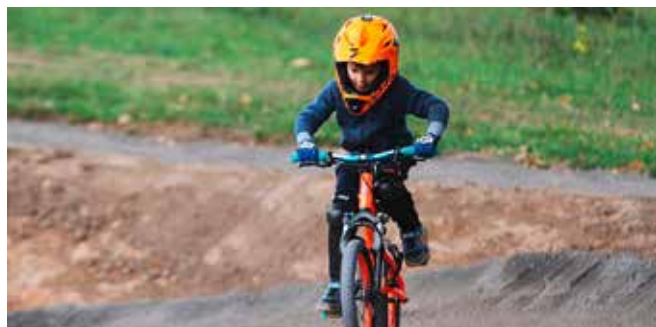
Junger Biker beim Training