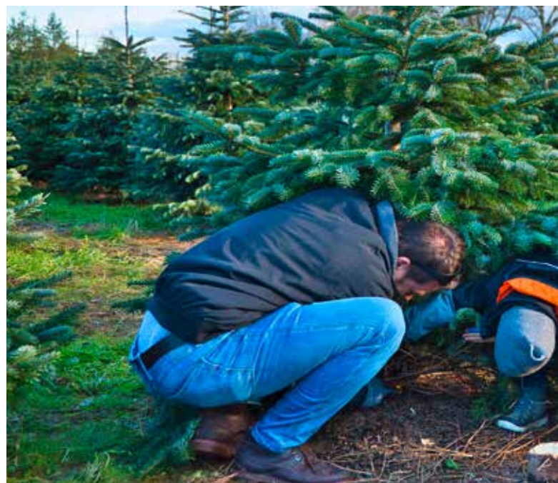
Unser Tipp für den nächsten Familienausflug: Weihnachtsbaum-Schlagen

Selbst Weihnachtsbäume zu schlagen, liegt absolut im Trend. Der Baum ist frischer und hält auch länger, bevor er seine Nadeln abwirft. Immer mehr Menschen lieben auch den Ausflug aufs Land in der Adventszeit und zelebrieren diesen Anlass als Familienausflug. Das Auto wird mit Dachgepäckträger oder Anhänger vorbereitet, Sägen werden geschärft, nochmal schnell die Zimmerhöhe ausgemessen. Dann beginnt das kleine Abenteuer der Suche nach dem perfekten Baum – zum Beispiel auf dem Thüringer Tannenhof ehemals Tannenhof Passen in Wittchenstein.