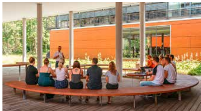
Grünes Klassenzimmer auf dem Campus