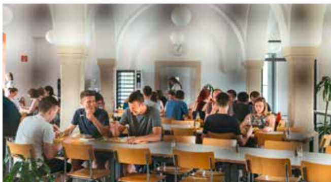
Die Mensa der DHGE