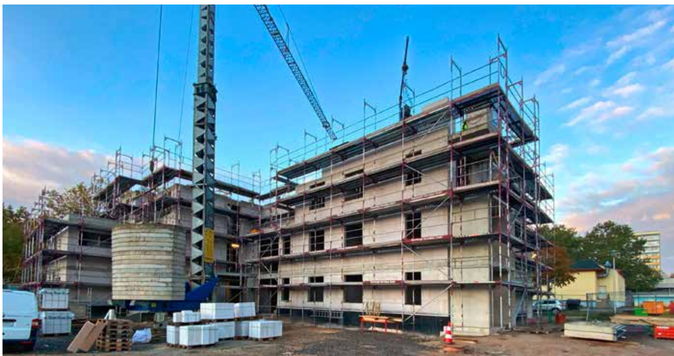
Aktuelles Baugeschehen am Heeresberg

Auf dem insgesamt 7.000 m 2 großen Grundstück mit Wohnbebauung, Parkanlage und Stellflächen für PKW werden in vier Gebäuden Wohnräume wahr. In den 2- bis 4-Raum-Wohnungen von 50 bis 131 m 2 wird eine Wohlfühlatmosphäre in einem naturverbundenen, aber trotzdem urbanen Umfeld geschaffen. Außerdem entstehen in zwei der vier Häuser jeweils 22 Wohnplus-Apartements von 23 bis 42 m 2 in Senioren-Wohngemeinschaften mit separatem Zugang, Treppenhaus und einem zweiten Aufzug. Die EGG wird zwei öffentliche Stromtankstellen mit jeweils zwei Ladepunkten à 22 kW im Quartier installieren. Damit stehen den Bewohnern vier Ladeparkplätze mit insgesamt 88 kW Ladeleistung zur Verfügung.