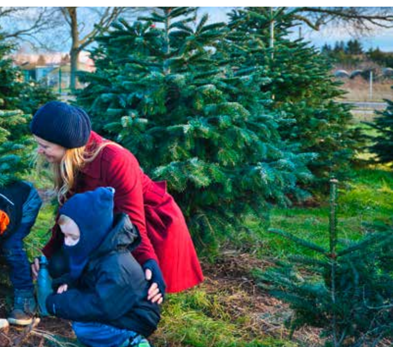
auf dem Tannenhof

Wir sorgen für das kulinarische Wohl unserer Besucher, sowohl an den Wochenenden als auch unter der Woche. Es gibt Glühwein, Bratwurst und andere Leckereien für Groß und Klein, sowie ein paar Stände mit regionalen Produkten und einen kleinen Laden mit weihnachtlichen Dekoartikeln.