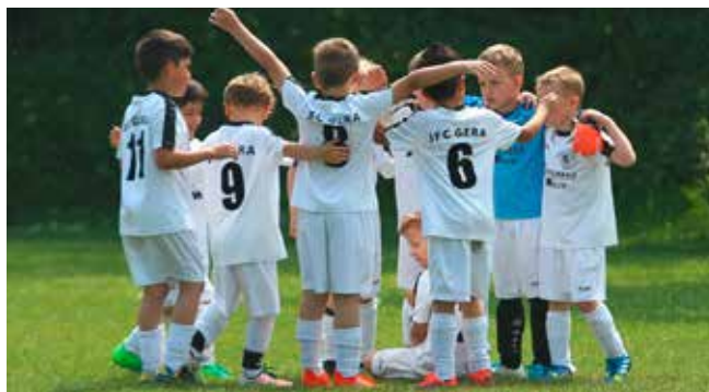
Die Kids vom JFC Gera