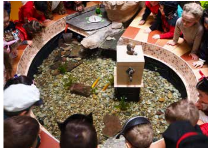
GROSSES STAUNEN BEI DEN KINDERN, DENN PÜNKTLICH ZUM ROSEN-MONTAG SCHWAMMEN WIEDER FÜNF KLEINE GOLDENE FISCHERLEIN IM BRUNNEN DER KITA „PERLBOOT“