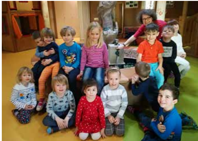
DIE GROSSEN DER KLEINEN KNIRPSE AUS DER KITA „PERLBOOT“ HABEN SICH MÄCHTIG DAFÜR EINGESETZT, DEN BRUNNEN WIEDER MIT LEBEN ZU FÜLLEN

Sozial- & Umweltfonds 2018 - Kindereinrichtungen, Schule und Jugendclub erhalten Zuschuss