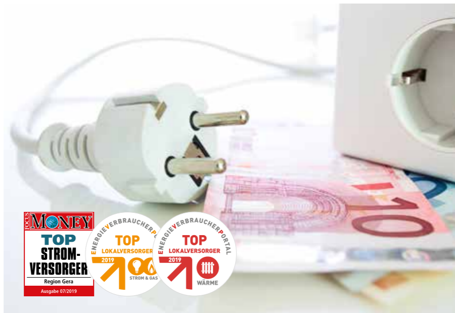
ACHTEN SIE BEI DER WAHL IHRES STROMANBIETERS AUF QUALITÄTSSIEGEL