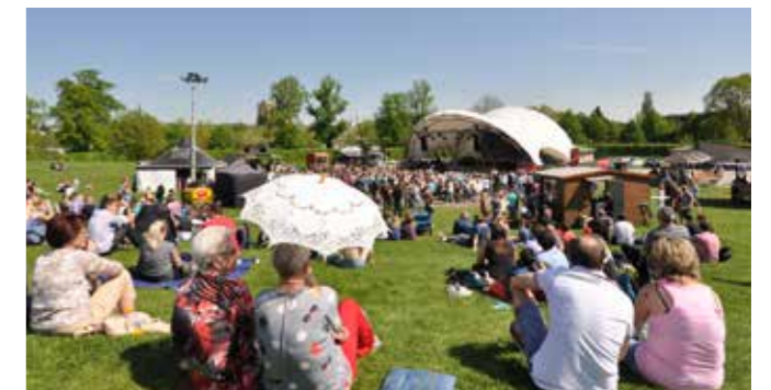
DAS DREITÄGIGE HOFWIESENBERG-PARK-FEST LÄDT ZUR AUSGEDEHNTEN FAMILIENZEIT

Hinweis: Die Coupons können Sie beim Ticketkauf in der Gera-Information, Markt 1a, 07545 Gera einlösen. (Öffnungszeiten: Mo-Fr 9 - 18 Uhr, Sa 10 - 15 Uhr)