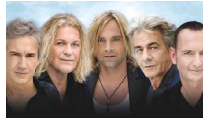
DIE MUSIK DER MÜNCHENER FREIHEIT LÖST EINE BESONDERE ANZIEHUNGSKRAFT AUS UND VERBINDET BIS HEUTE GENERATIONEN

EGG lädt zum Hofwiesenbergpark-Fest mit vergünstigten Tickets