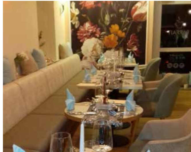
DAS CAFÉ PARFAIT BESTICHT DURCH SCHLICHTE ELEGANZ

Noch ein Tipp: Die hauseigene Schoko-Mousse-Torte ist unsere süße Empfehlung zum Nachmittagscafé.