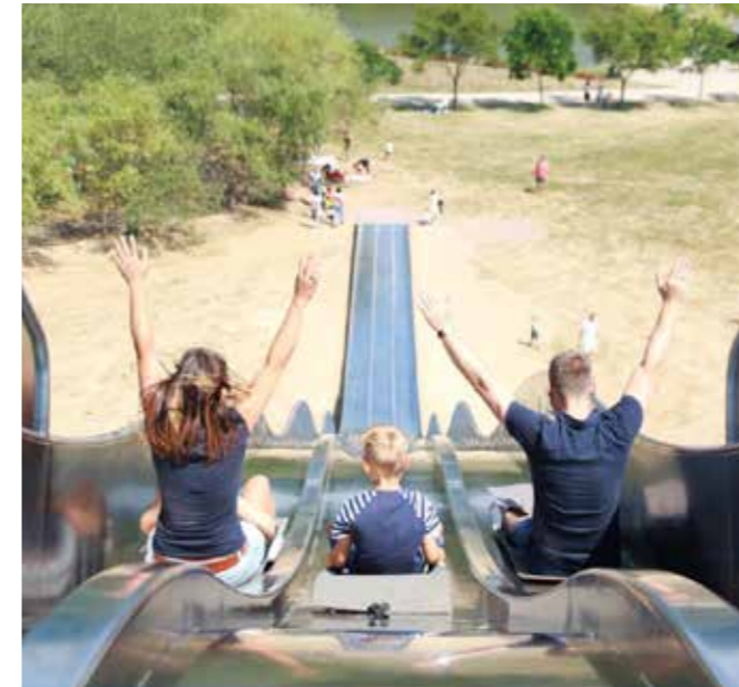
DIESES WAHRE RUTSCHENPARADIES BIETET MIT TUNNEL-, KASTEN- UND WELLENRUTSCHEN NERVENKITZEL UND SPASS FÜR DIE GANZE FAMILIE UND IST BEREITS IM PARKEINTRITT ENTHALTEN

Pünktlich zum 1. April eröffnete der Sonnenlandpark Lichtenau die Saison. Bis 31. Oktober ist der Park täglich von 10 bis 18 Uhr, im Juli und August sogar bis 19.30 Uhr, geöffnet. Das weitläufige Gelände erstreckt sich zwischen Chemnitz und Mittweida und bietet Erholung, Abenteuer, Spaß und Natur. Im Sonnenlandpark vereinen sich Freizeitpark, Wildgehege und Indoor-Spielplatz.