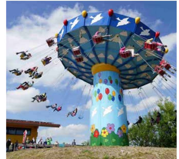
GROSSER BELIEBTHEIT ERFREUT SICH AUCH DER WELLENFLIEGER. AUF DIESEM KETTENKARUSELL KÖNNEN SICH 40 MUTIGE GLEICHZEITIG IN DIE LÜFTE SCHWINGEN

Wer lieber im Trockenen das Abenteuer sucht, sollte den höchsten Rutschurm Deutschlands erklimmen. Vom 30 Meter hohen Turm schlängeln sich Rutschen aus unterschiedlichen Höhen auf einer Gesamtlänge von 370