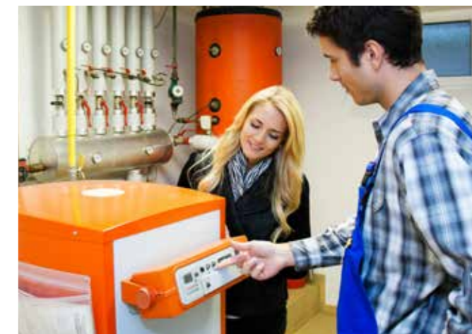
DIE TURNUSMÄSSIGE FACHPRÜFUNG DER GASANLAGEN FÜHREN ZERTIFIZIERTE HANDWERKSBEREITBE DURCH

mit einem Ergebnisprotokoll nachgewiesen werden. Dieses Protokoll gehört in die „Hausakte“. Bei dieser Prüfung werden alle Anlagenteile auf Herz und Nieren geprüft. Die Betreiber erhalten eine technische Expertise und können die Unbedenklichkeit der Gasanlage auch gegenüber dem Gebäudeversicherer nachweisen. EGG-Kunden können sich einen Bonus für die regelmäßige Wartung der Gasanlage sichern.