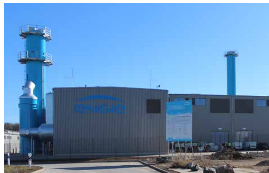
DAS ENGIE-HEIZKRAFTWERK IN GERA-TINZ IST SEIT ANFANG DES JAHRES IN BETRIEB

Alle traditionell jährlich stattfindenden Veranstaltungen im Hofwiesenberg, wie das Hofwiesenberg-Fest, der Hofwiesenbergparklauf, der Elstertal-Marathon sowie der Powertriathlon wurden bei der Bauablaufplanung berücksichtigt. Die Veranstaltungen können trotz der Bautätigkeiten planmäßig stattfinden.