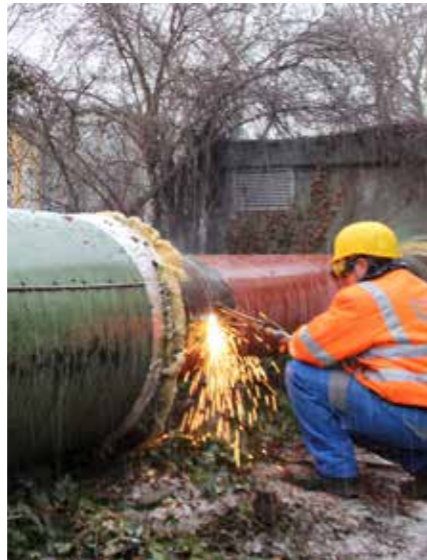
HISTORISCHER TRENNSCHNITT: ABTRENnung DER HOCHDRUCKDAMPFRASSE

Mit dem Neubau der Heizkraftwerke in Gera-Tinz und Gera-Lusan geht auch eine Neuaufstellung der Fernwärmeversorgung in Gera einher. Nach über 50 Jahren Hochdruckdampfversorgung ist im Zuge der Fernwärmebauarbeiten deshalb Mitte Januar der historische Trennschnitt der Hochdruckdampftrasse Nord im Bereich Orangerie/ Küchengarten erfolgt. Die Außerbetriebnahme des Hochdruckdampfnetzes zwischen der