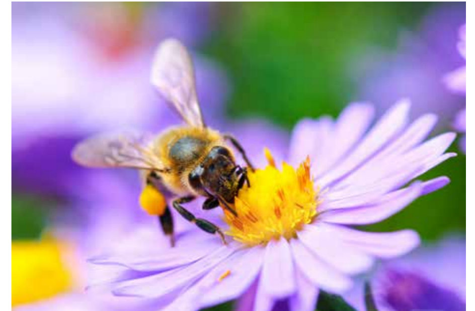
INSEKTENFREUNDLICHE BLUMEN SIND WAHRE OASEN FÜR HUNGRIGE BIENEN

Über Dreiviertel der heimischen Pflan-zen sind von der Bestäubung durch Bie-nen abhängig. Mit dem Genuss von regionalem Honig leisten Sie einen akti-ven Beitrag zum Erhalt der Artenvielfalt. Was die Bienen sammeln und die Imker verarbeiten, besteht aus natürlichem Frucht- und Traubenzucker, Enzymen, Aminosäuren und zahlreichen Mineral-stoffen. Die Vielfalt der regionalen Natur verleiht dabei jedem einzelnen Glas etwas Besonderes.