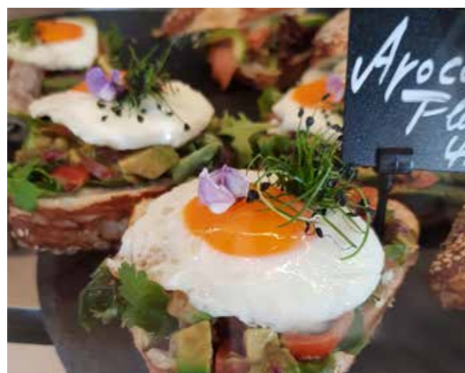
EIN ABSOLUTER GENUSS: EIN HALBES BRÖTCHEN AN FRISCHER AVOCADO UND SPIEGELEI