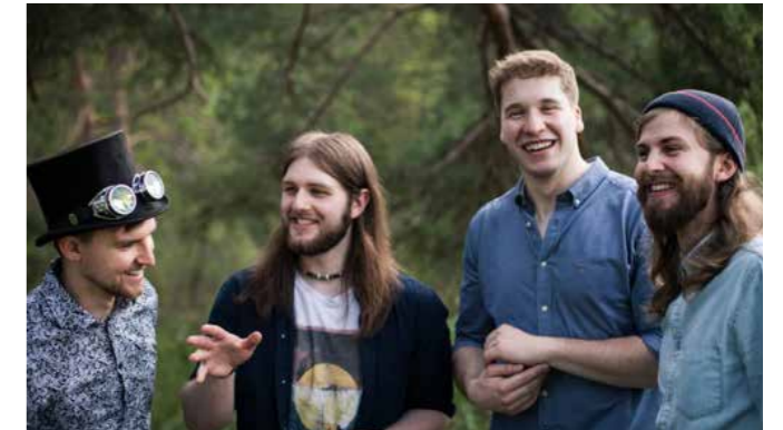
DIE VIER JUNGS VON „THE GREAT CASCADE“ WURDEN 2018 ZUR BESTEN NEWCOMER-BAND THÜRINGENS AUSGEZEICHNET

Die ausgedehnte Familienzeit wird von Sonnabend, 14 Uhr bis Sonntag, 20 Uhr gefeiert. Vereine und Einrichtungen in und um Gera laden an zwei Tagen auf „Geras größten Kinderspielplatz“, rund um das Spielfeld, zum Ausprobieren, Mitmachen, Toben, Lachen ein. Das komplette Programm gibt es unter www.tourismus.gera.de