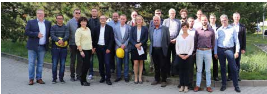
Energieeffizienz im Blick: Teilnehmer des Netzwerktreffens in Gera bei der EGG

Das Netzwerktreffen des Energieeffizienz-Netzwerks EVU Thüringen und des Kommunalen EnergieeffizienzNetzwerks fand am 24. September 2019 bei der EGG statt. Die teilnehmenden Unternehmen erhielten einen Einblick in die Erzeugung von Fernwärme und Strom mittels Kraft-Wärme-Kopplungsanlagen.