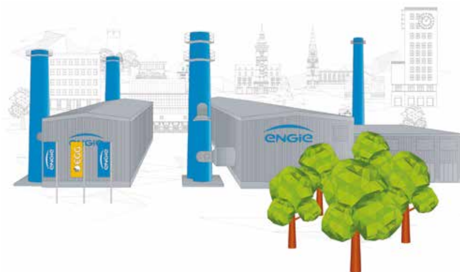
Heizkraftwerke in Gera-Lusan und Gera-Tinz: die Wärme vor Ort erzeugen und dabei die Effizienz erhöhen

Nutzen Sie den QR-Code, um den Film „Energie made in Gera“ zum Fernwärmeprojekt von ENGIE und der EGG zu sehen.