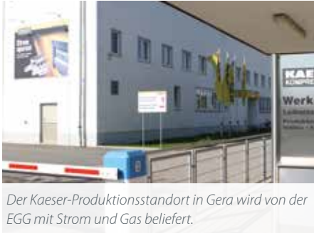
Der Kaeser-Produktionsstandort in Gera wird von der EGG mit Strom und Gas beliefert.

Die zuverlässige Bereitstellung von Energie zu marktgerechten Preisen für unsere Geschäftskunden aus Industrie und Wirtschaft – dafür steht die EGG. Sie ist die Grundlage für viele weitere Energieservices für Unternehmen, Institutionen und Betriebe, wie z. B. unser Contracting (s. S. 5). Auf dieses Know-how der EGG setzt auch seit vielen Jahren unser Großkunde Kaeser Kompressoren SE – einer der weltweit führenden Hersteller und Anbieter von Produkten und Dienstleistungen im Bereich Druckluft. Die EGG beliefert den Produktionsstandort Gera mit Strom und Gas.