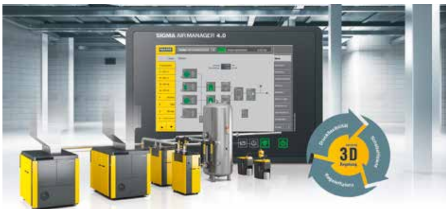
Kaeser liefert eine effiziente, zuverlässige und wirtschaftliche Druckluftversorgung für jeden Bedarf.

Ihr Unternehmen zieht um, eröffnet eine Niederlassung oder wird neu gegründet? Die EGG bietet Ihnen die Möglichkeit, sich schnell und unkompliziert über Tarife und Services zur Strom-, Gas- und Fernwärmlieferung zu informieren. Auf unserer Webseite www.energieversorgung-gera.de können Sie sich auch direkt über das Online-Portal anmelden und unsere Services nutzen.