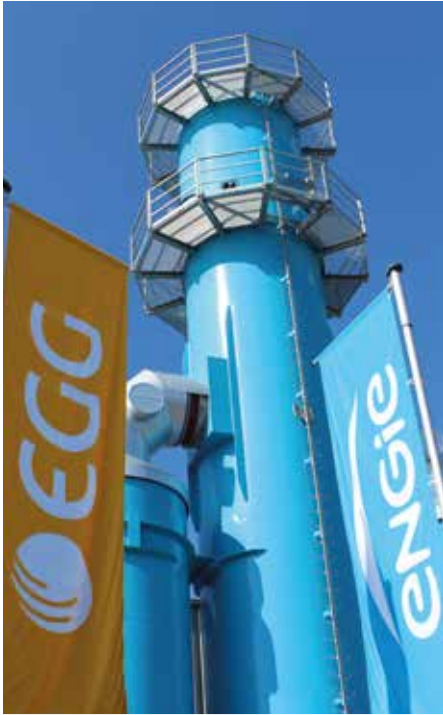
Gemeinsam in eine nachhaltige Strom- und Wärmeversorgung für Gera investiert: ENGIE und EGG

Das über 20 Jahre alte Heizkraftwerk Gera-Nord und das Heizwerk Süd der EGG wurden im Januar bzw. Juni 2019 außer Betrieb genommen. ENGIE hat 46 Mio. Euro in den Neubau der Kraftwerke investiert, die EGG zusätzlich ca. 8 Mio. Euro in die neue Fernwärmenetz-Struktur. Die Energieversorgung der Stadt Gera ist damit für die nächsten Jahre nachhaltig und sicher aufgestellt.