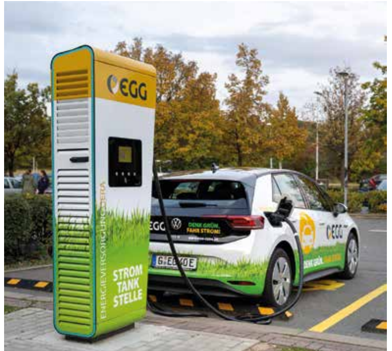
Spitzenplatz bei der E-Mobilität: Mit 63 EGG-Ladepunkten steht Gera unter den Top 3 in Thüringen

Die EGG hat seit 2016 kontinuierlich in die Ladeinfrastruktur für E-Mobile in Gera investiert und diese stetig ausgebaut. Neben 24 Normalladesäulen (AC) und 5 Schnellladesäulen (DC) wurde Mitte dieses Jahres der erste Hypercharger (HPC, high power charging) in Gera eröffnet. Mit dieser neuen Ladesäule kann mit einer maximalen Ladeleistung von 150 kW in absoluter Rekordzeit Strom getankt werden.