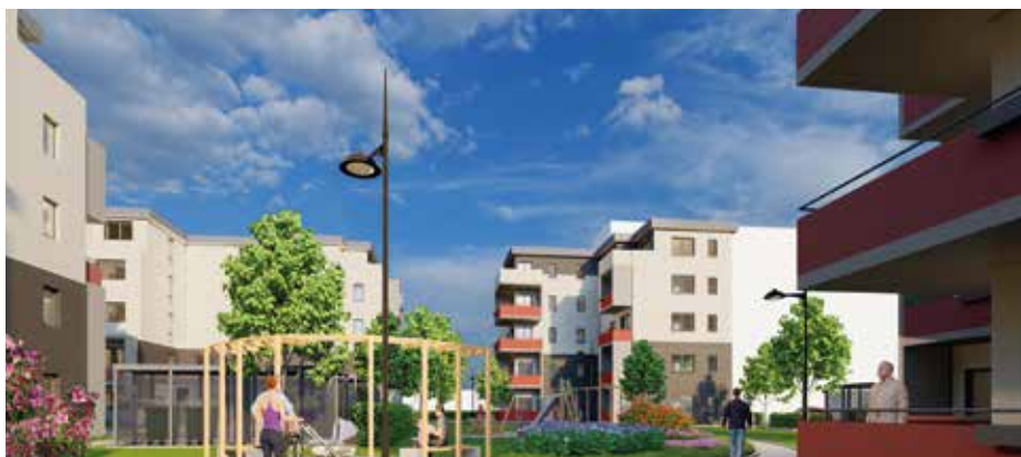
Wohnungsbauprojekt „Weidencarré – Glücklich wohnen am Heeresberg“: Nachhaltiges Wohn- und Lebenskonzept in Gera mit Fernwärme und Stromtankstellen der EGG

Mit dem Wohnungsbauprojekt Weidencarré realisiert die WBG „Glück Auf“ ihre Vision eines nachhaltigen Wohn- und Lebenskonzepts. Das Wohnquartier am Rande des Geraer Stadtteils Lusan vereint das generationenübergreifende Wohnen von jungen Menschen, Familien und Senioren. Hier genießen die künftigen Bewohner einen unverbauten Blick über das Elstertal, zum Zoitzberg und in den grünen Innenbereich des Carrés.