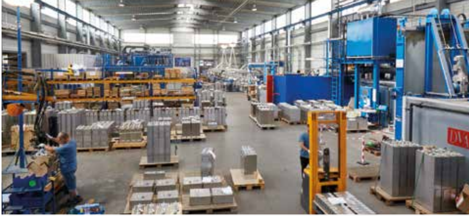
Fertigung von ELECTRONICON in Gera-Hermsdorf – mit Strom und Erdgas, die seit Jahrzehnten von der EGG geliefert werden.

In die Herstellung von Folienkondensatoren fließt ein gehöriges Maß an elektrischer Energie ein. Für den ausschließlich in Gera produzierenden Kondensatorspezialisten ELECTRONICON sind das insbesondere das Aufdampfen der Metallbeläge im Metallisierungszentrum Gera-Pforten, die qualitätsbestimmende Klimatisierung für die Wickelherstellung sowie die aufwendige Vakuumtrocknung vor dem Versiegeln der Kondensatoren in den beiden Werken Gera-Keplerstraße und Gera-Hermsdorf. Die notwendige Energie in Form von Strom und Erdgas bezieht Deutschlands führender Hersteller dieser Komponenten mit dem aussagekräftigen Slogan „always in charge“ schon seit Jahrzehnten von der EGG. Gerade erst wurden Lieferverträge wieder verlängert – ein Beweis für die vertrauensvolle Zusammenarbeit der beiden Geraer Unternehmen.