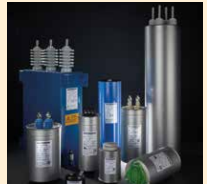
Kondensatoren 100 % Made in Gera