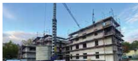
Baufortschritt Weidencarré im November 2021

Mehr Informationen unter: www.weidencarré-gera.de