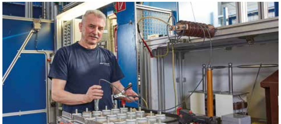
Vor seinem Versand in alle Welt wird jeder Kondensator aufwendig elektrisch geprüft.

Umso wichtiger ist, dass das Unternehmen ELECTRONICON selbst energiebewusst agiert und dabei auf lokale Partner setzt. Als 2011 in Gera-Hermsdorf eine neue Fertigungsstätte für die Großkondensatoren erforderlich wurde, erfolgte umgehend die reibungslose Anbindung durch die EGG. Gegenwärtig befindet sich das Unternehmen erneut in einer Phase starken Wachstums. Für die zahlreichen dafür anstehenden Investitionen ist auch die Absicherung der Energieversorgung von grundlegender Wichtigkeit – in Kooperation mit dem Energiepartner vor Ort, der EGG.