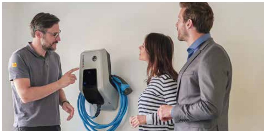
Der Ladecheck der EGG bietet auch Unternehmen und Gewerbebetrieben den idealen Einstieg in die E-Mobilität

Die EGG ist Vorreiter im Bereich Elektromobilität und damit der richtige Ansprechpartner für Unternehmen, Gewerbebetriebe und Institutionen, die über den Kauf von Elektroautos, die passende Ladetechnik oder den Abschluss von Ladedarifen nachdenken.