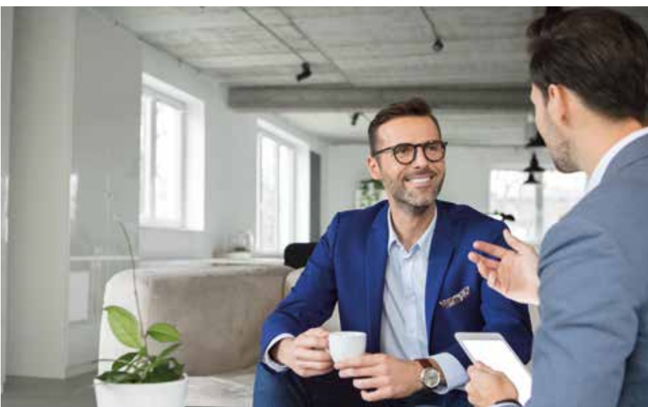
Contracting: All-in-one-Konzept für Immobilienbesitzer