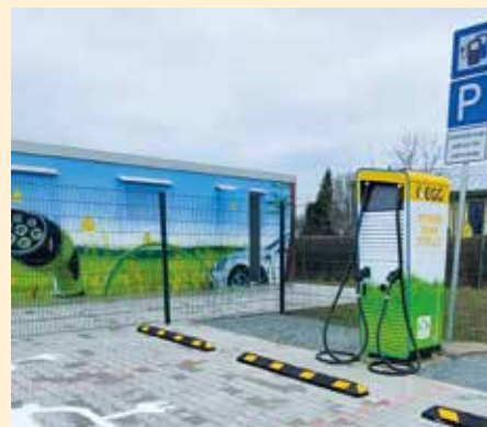
Im Industriegebiet Cretzschwitz, direkt an der B2, betreibt die EGG eine Super-Schnellladesäule mit bis zu 300 kW Ladeleistung.

Voraussichtlich bis zur Jahresmitte 2022 werden zwei weitere HPC-Ladesäulen mit einer Ladeleistung von jeweils 150 kW am Einkaufspark Braustraße sowie im Einkaufs-Carré Dornaer Straße in Betrieb genommen. Des Weiteren sollen in diesem Jahr in der Keplerstraße ein Ladepark mit einer 300 kW HPC-Ladesäule sowie zwei weitere Normal-ladesäulen im Stadtgebiet installiert werden.