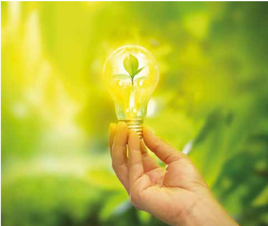
Grüner Strom als wichtiger Teil der Energiewende: Immer mehr Geschäftskunden der EGG setzen auf Ökostrom, so auch Concentrix.