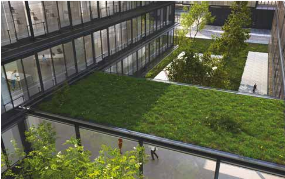
„Green Building“ für Unternehmen: Dachflächen werden zu Gärten und tragen dazu bei, Energie zu sparen und negative Umwelteinflüsse einzudämmen

Mit einem Gründach verbessert sich die energetische Leistung des Gebäudes. Die Vegetation reguliert die Temperatur des Gebäudes und sorgt für niedrigere Energiekosten. Im Winter geht weniger Energie über das Dach verloren. Im Sommer schirmt das begrünte Dach die Hitze ab. Das spart Kosten für die Klimatisierung.